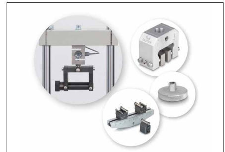
Solide und flexible Befestigungsmöglichkeiten durch eine hohe Anzahl an Klemmen und Zubehörteilen aus dem SAUTER Sortiment, siehe Zubehör